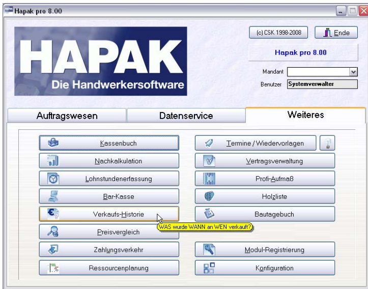
Abbildung 1: Start der Verkaufshistorie

Klicken Sie auf die Schaltfläche Verkaufshistorie über Hauptmenü - Weiteres - Verkaufshistorie , öffnet sich diese.