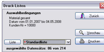
Abbildung 13: Auswahlbedingungen Listen-Druck

Die entsprechend Auswahl wird Ihnen im folgenden Dialog nochmals angezeigt: